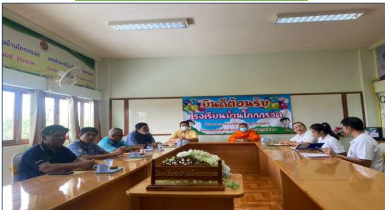
การประชุมคณะกรรมการสถานศึกษา เพื่อชี้แจงการดำเนินงาน