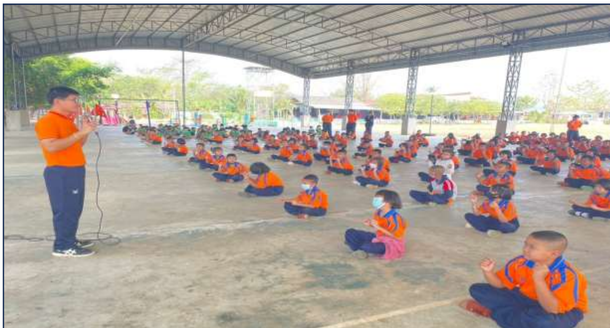
ให้ความรู้กับนักเรียนในการดำเนินกิจกรรม