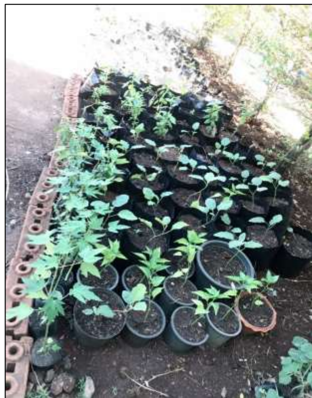
กิจกรรมเศรษฐกิจพอเพียงในสถานศึกษาสู่ชุมชน