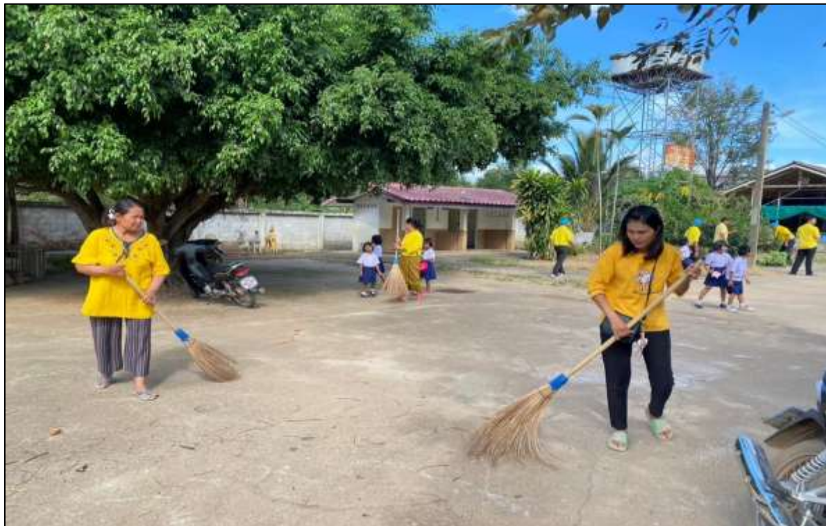
กิจกรรมบำเพ็ญประโยชน์เนื่องในวันพระราชสมภพพระเจ้าอยู่หัว รัชกาลที่ ๑๐