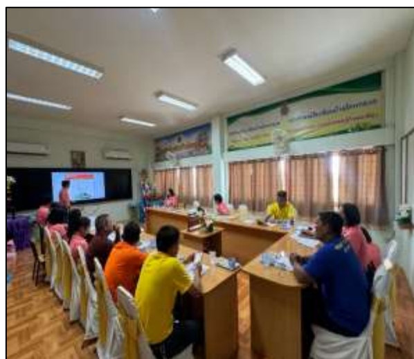
ครูและบุคลากรทางการศึกษาประชุมหารือร่วมกัน