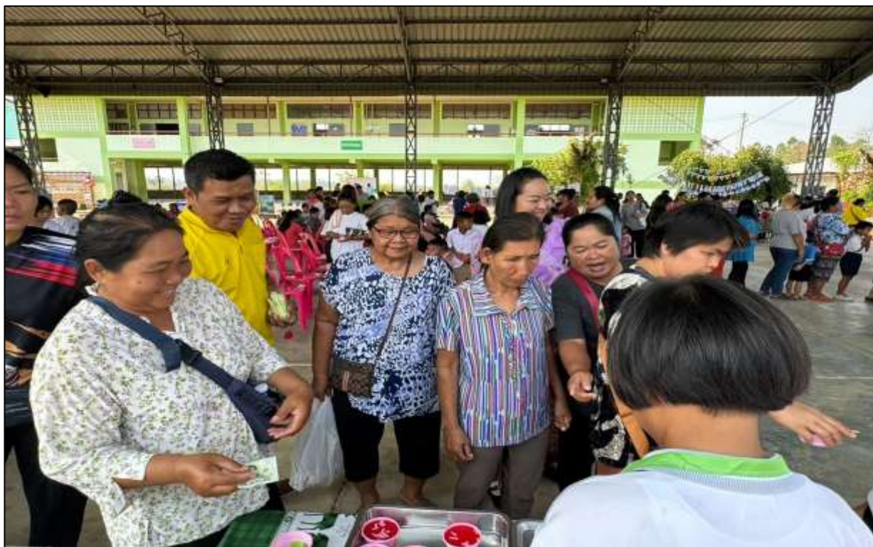
กิจกรรมเปิดบ้านพบโรงเรียนเพื่อแสดงผลการจัดกิจกรรมตลอดปีการศึกษา